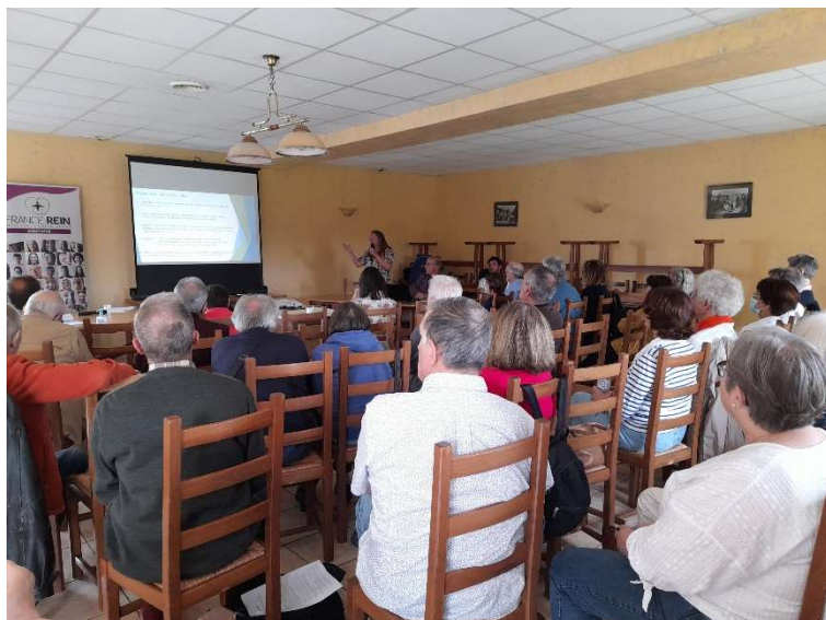
Le public attentif

En hémodialyse, de nombreux patients souffrent de prurit (démangeaisons) qui altère leur qualité de vie et perturbe leur sommeil. Jusqu'à maintenant, les médecins ne disposaient d'aucun traitement vraiment efficace dans ces cas. Un nouveau médicament spécifique, la difélikéfaline, ayant récemment obtenu l'AMM (Autorisation de Mise sur le Marché), apporte une amélioration sensible aux patients concernés.