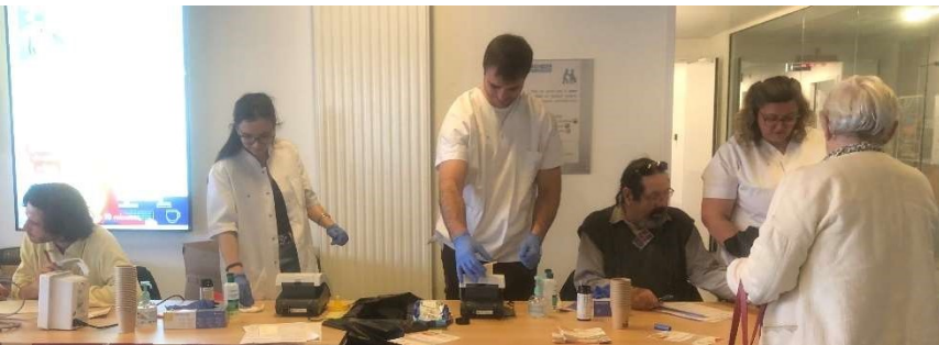
CH d'Agen-Nérac : Pôle Santé de Villeneuve sur Lot (47)