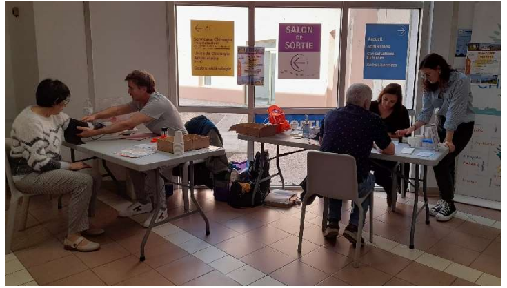
CH de Mont-de-Marsan (40)