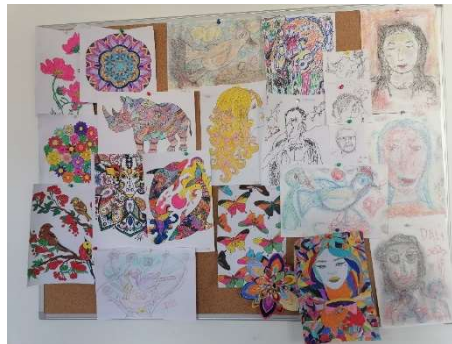
Tableau d'affichage des créations faites pendant les séances de dialyse