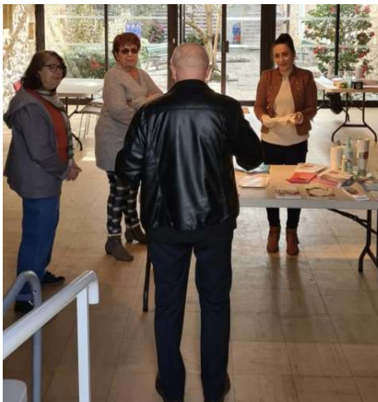
Maison du Rein – AURAD Aquitaine à :