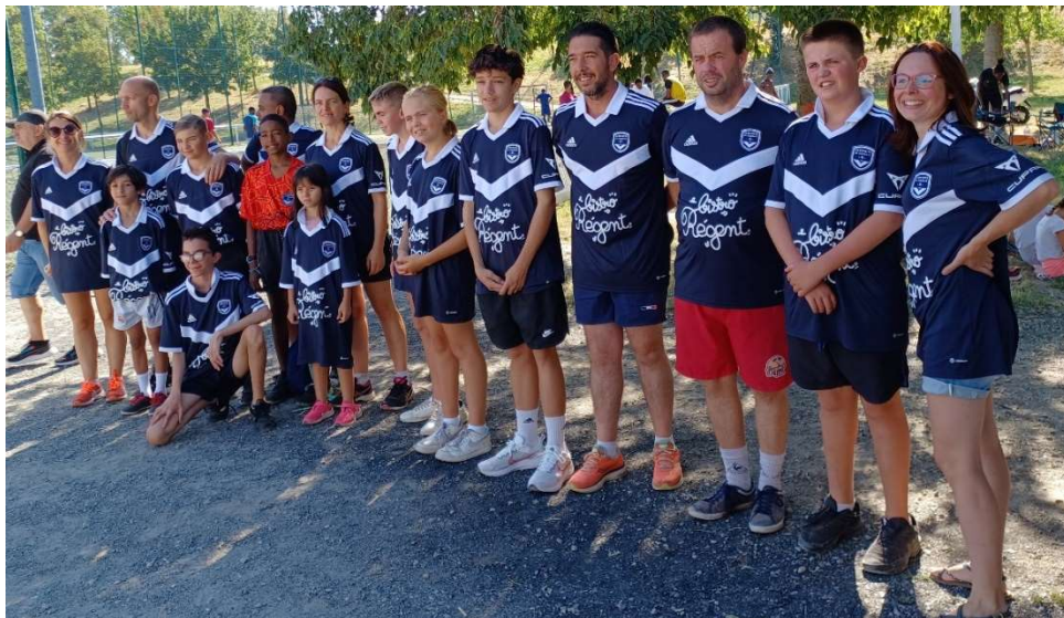
L'équipe du CHU de Bordeaux

Avec 35° à l'ombre, il fallait surveiller l'hydratation, en particulier des dialysés, très grand professionnalisme des soignants !