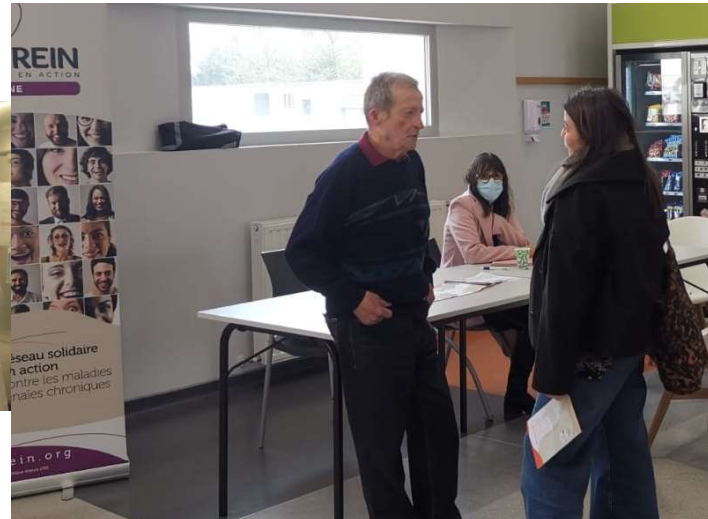
CH d'Oloron-Sainte-Marie (64)