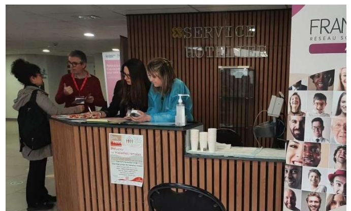
Elsan-Saint-Martin Pessac (33): en partenariat avec ESEA (e-santé en action) et la CPAM pour Mon espace Santé