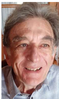
Le président Jean-Pierre BLANC