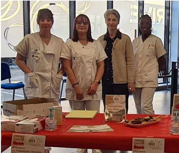
Clinique Francheville : Périgueux (24)