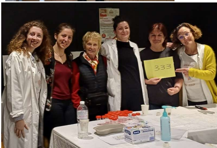
Elsan-CTMR (33) Auchan Bordeaux Lac (record absolu)