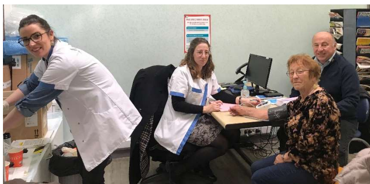
NephroCare à l'EFS de Pau (64)