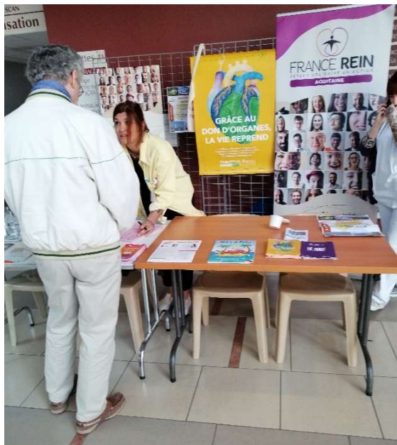
CH de la Côte Basque Bayonne (64)