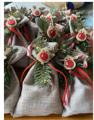
Petits pochons de friandises faits par les aides-soignants